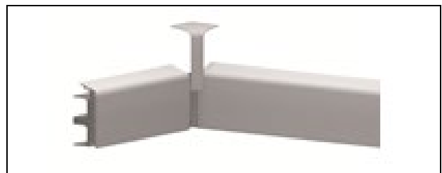
Abb. 2: Montage der HZ-Innenecke