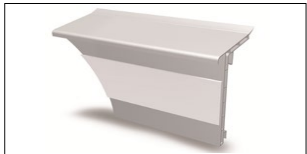
Abb. 7: HZ-Teppichsockelleisten SLT