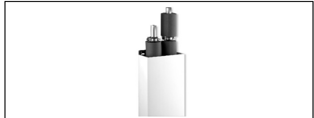
Abb. 9: HZ-Steigstrangprofil