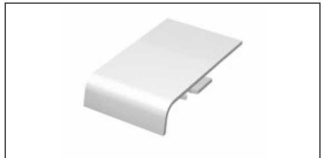
Abb.4: HZ-Stoßverbinder für SLT