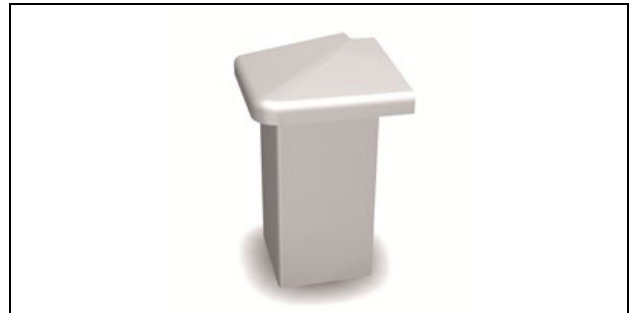
Abb. 3: HZ-Außenecke für SLT