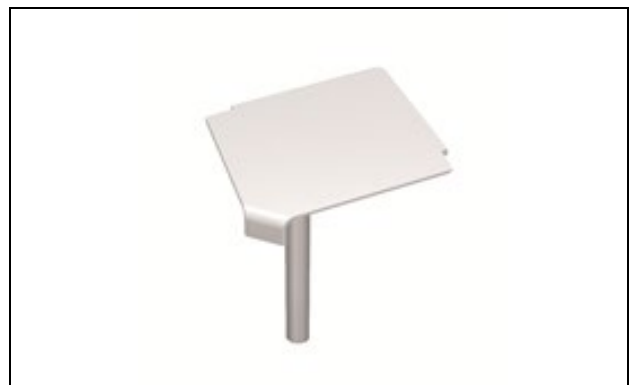
Abb. 1: HZ-Innenecke für SLT