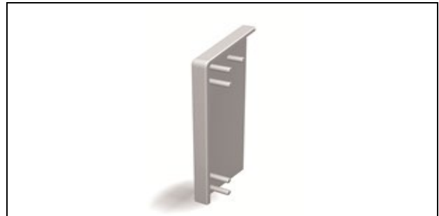
Abb.5: HZ-Endstück für SLT Links